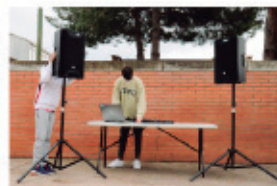
La calma abans de la festa