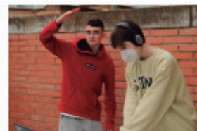
Gaudint de la música