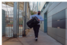
Esforç i sacrifici