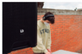
El principi d'un futur melòdic