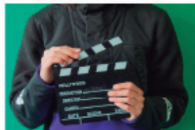
Silenci, llums, càmera...