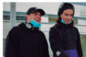
Amor de parella